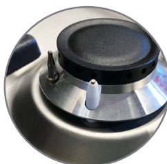
Gas Control System